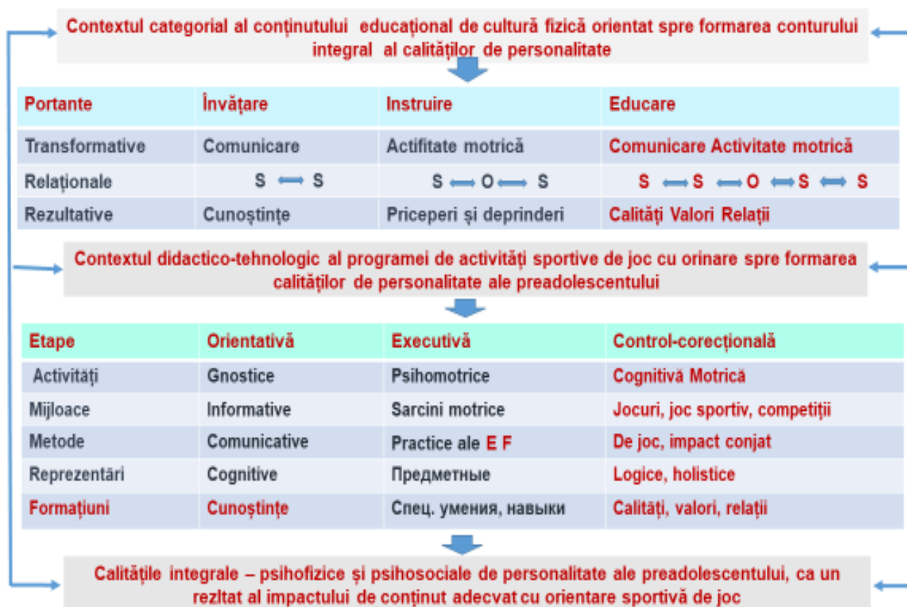
Fig. 2. Modelul programei pentru formarea pe etape a calităților de personalitate ale adolescente în cadrul conținutului educațional al jocului sportiv „Volei”: modificat de noi, după autorul S. Danail [20]

În conținutul primului bloc, după cum remarcă S.N. Danail [2023], procesul și rezultatul formării calității psihomotorii, ca de personalitate, psihofizice și psihosociale, presupune o trinitate de categorii fundamentale de educație: purtoare , precum învățarea - instruire - educare , care poartă, în sine ca rezultat cunoștințe - priceperi și deprinderi - calități, valori, relații, care, la rândul lor, se transformă în rezultat însuși prin influențe pedagogice asupra sferei cognitive, motorii, reglator-voliționale și intelectuale printr-o astfel de triadă de categorii precum comunicarea - activitatea motrică - complex de activitate motrică și comunicare .