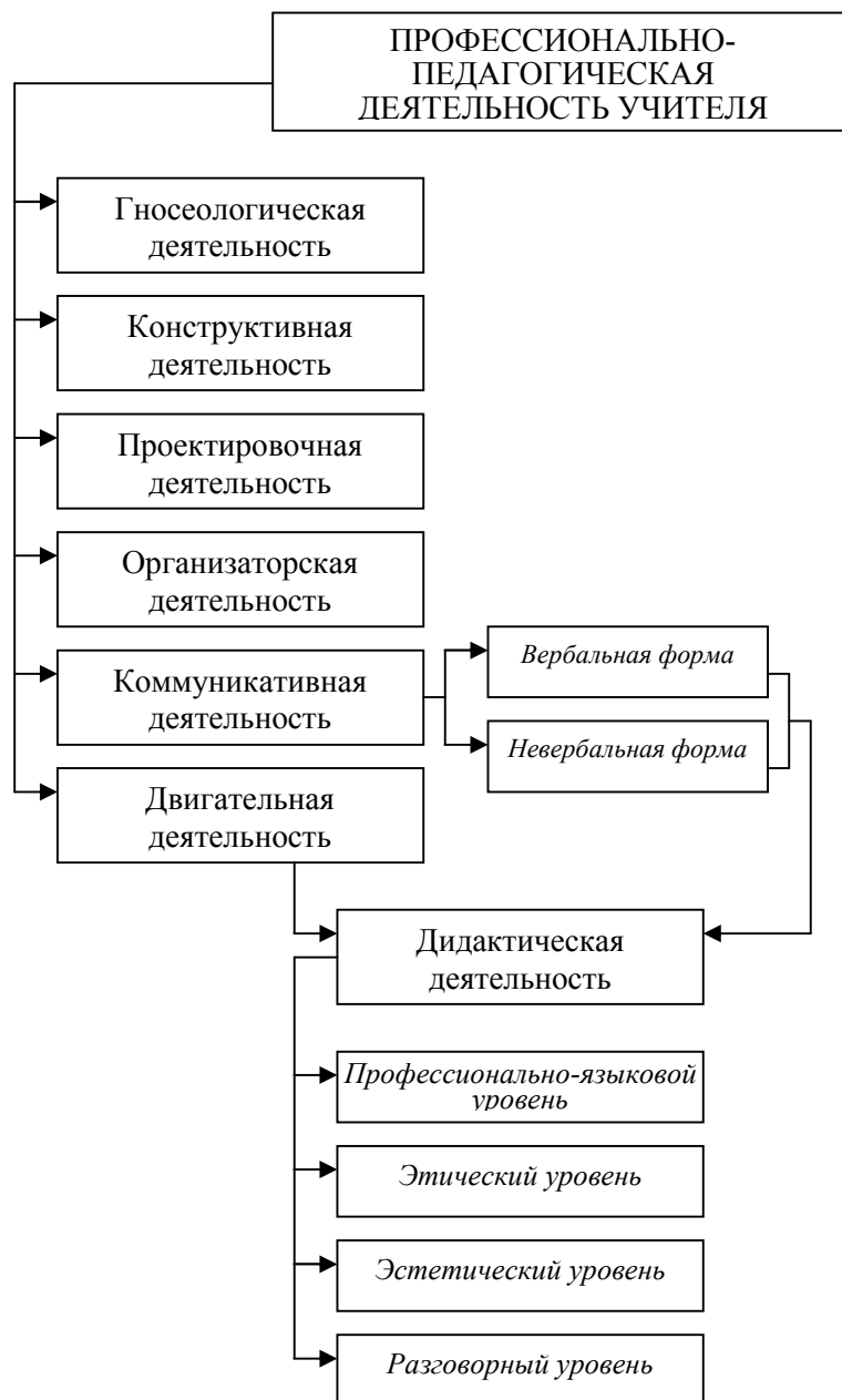
Рис. 1. Структура профессионально-педагогической деятельности учителя физической культуры

А поскольку любое качество личности представляет собой особое психическое образование, охватывающее все психические процессы (познавательные, волевые, эмоциональные), то уместно говорить, во-первых, о развитии соответствующих познавательных способностей: эстетического восприятия, мышления, фантазии.