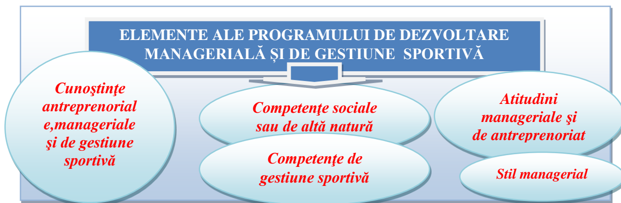
Fig.2. Elemente ale programului de dezvoltare managerială conform opiniilor lui Simmons și Brennan (1981), citat de [2], adaptat de noi

➤ învățare prin experiență sau „a învăța din muncă” ; experiență la locul de muncă, de regulă, sub îndrumarea superiorului sau a colegilor; schimbul de experiență.