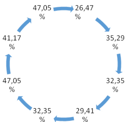
Fig. 2. Datele sondajului sociologic

Iar la întrebarea „dacă îndrumătorul (metodist) i-a oferit feed-back constructiv la sfârșitul orelor observate” este de 26,47%, iar, predate de – 35,29% din totalitatea generală (fig. 2).